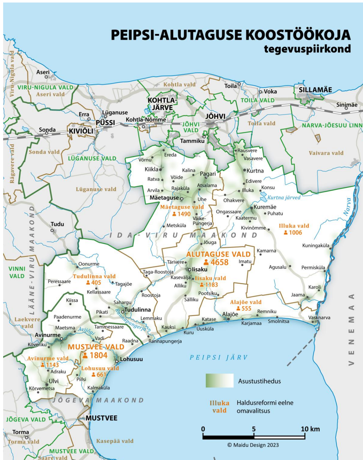
Joonis 1. Peipsi-Alutaguse Koostöökoja tegevuspiirkond (elanike arv seisuga 1.01.22, Rahvastikuregister)

PAKi tegevuspiirkond hõlmab 1757 km 2 suurust ala Ida-Virumaa lõunaosas (Alutaguse vald) ja Jõgevamaa kirdeosas (Mustvee valla Avinurme ja Lohusuu piirkonnad) (Joonis 1).